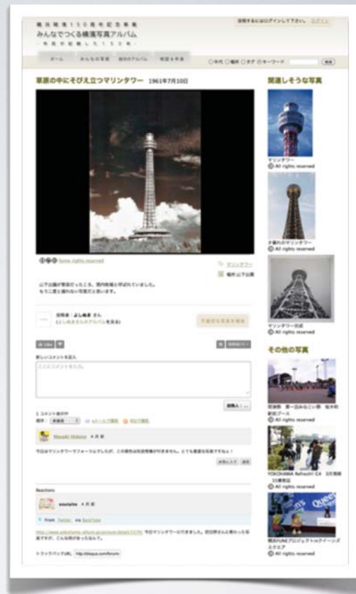
地域写真アーカイブ「みんなで作る横濱写真アルバム」 http://www.yokohama-album.jp/