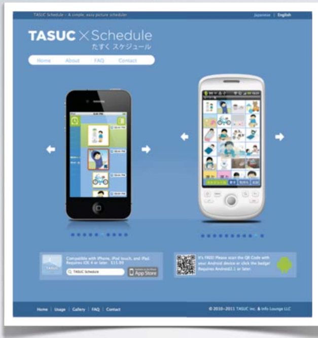
チャレンジド支援アプリ「たすくスケジュール」 http://apps.tasuc.com/