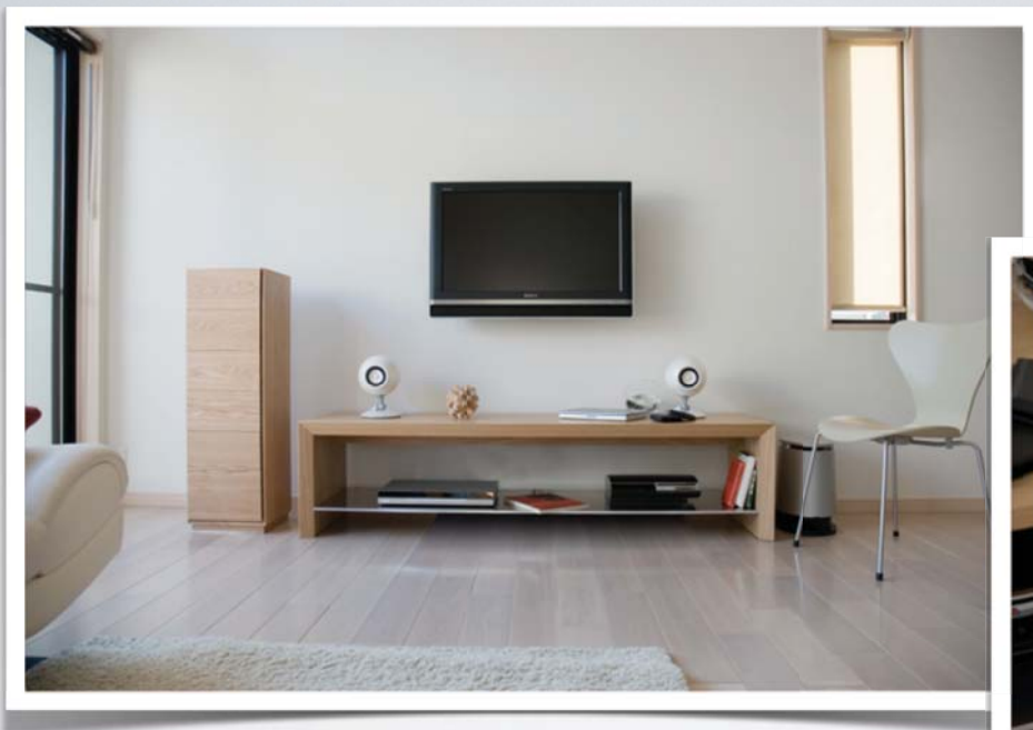
横浜の若手家具職人とのコラボ「無垢の家具」